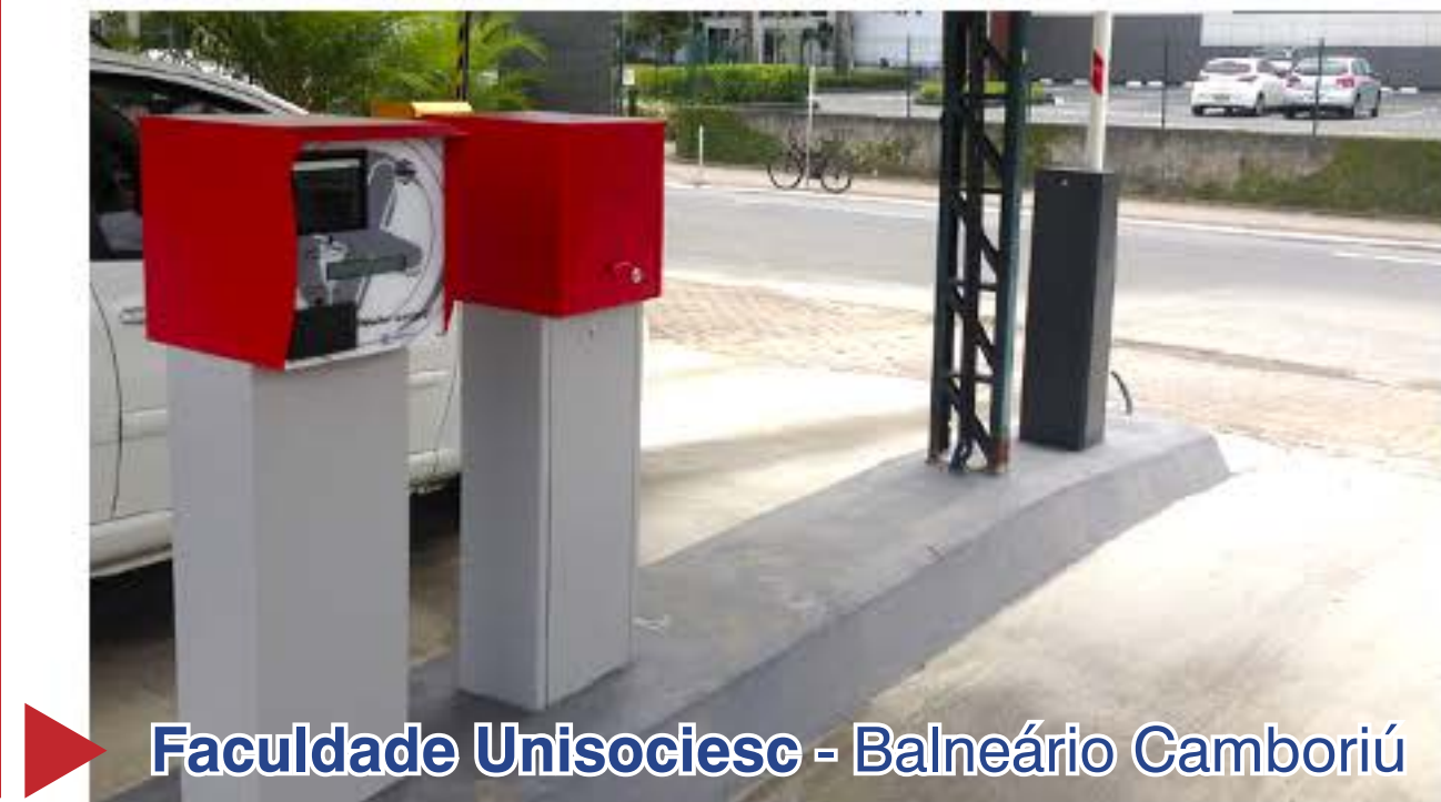
Faculdade Unisociesc - Balneário Camboriú