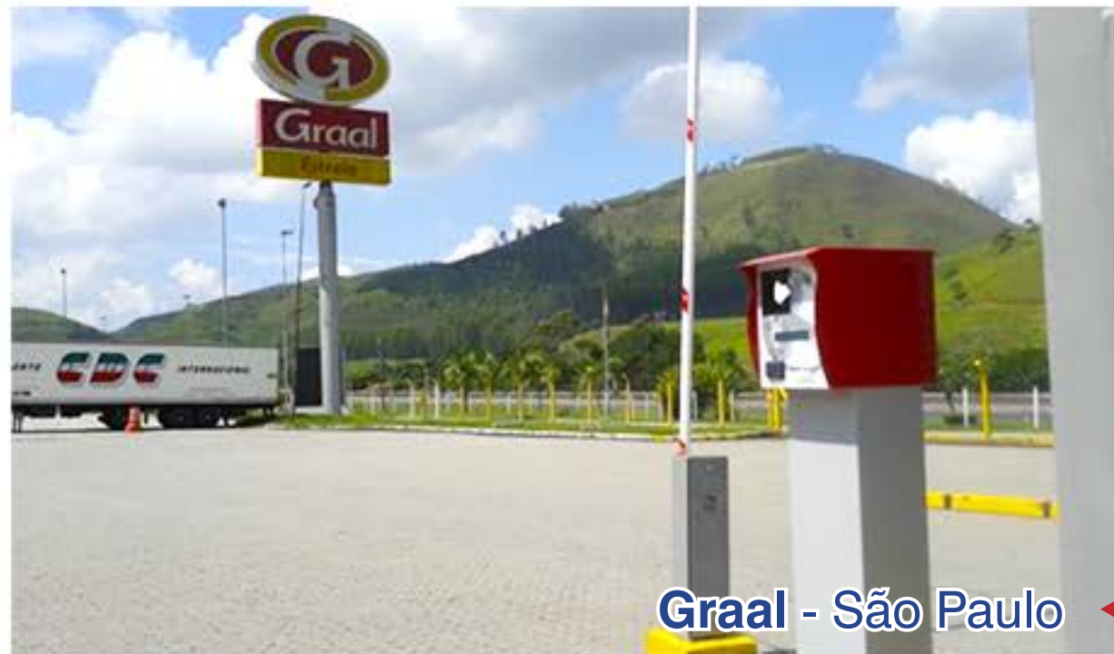
Graal - São Paulo

Veja algumas das empresa que instalaram o sistema de estacionamento Termoplus.