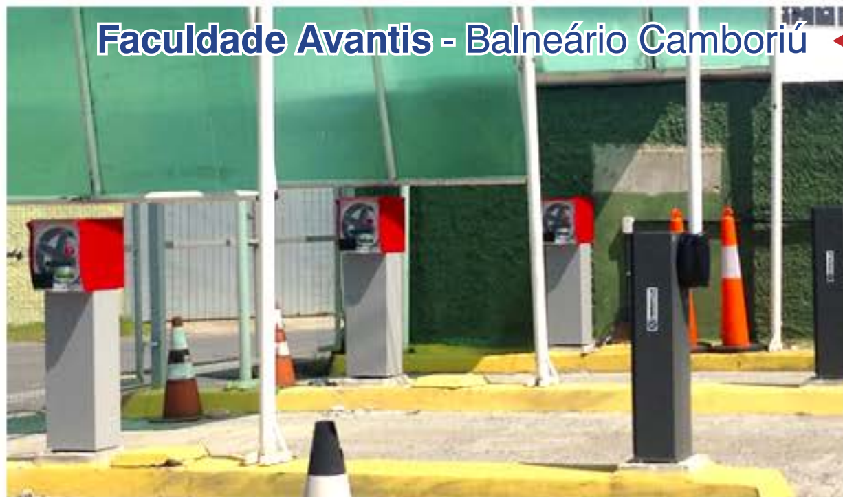
Faculdade Avantis - Balneário Camboriú