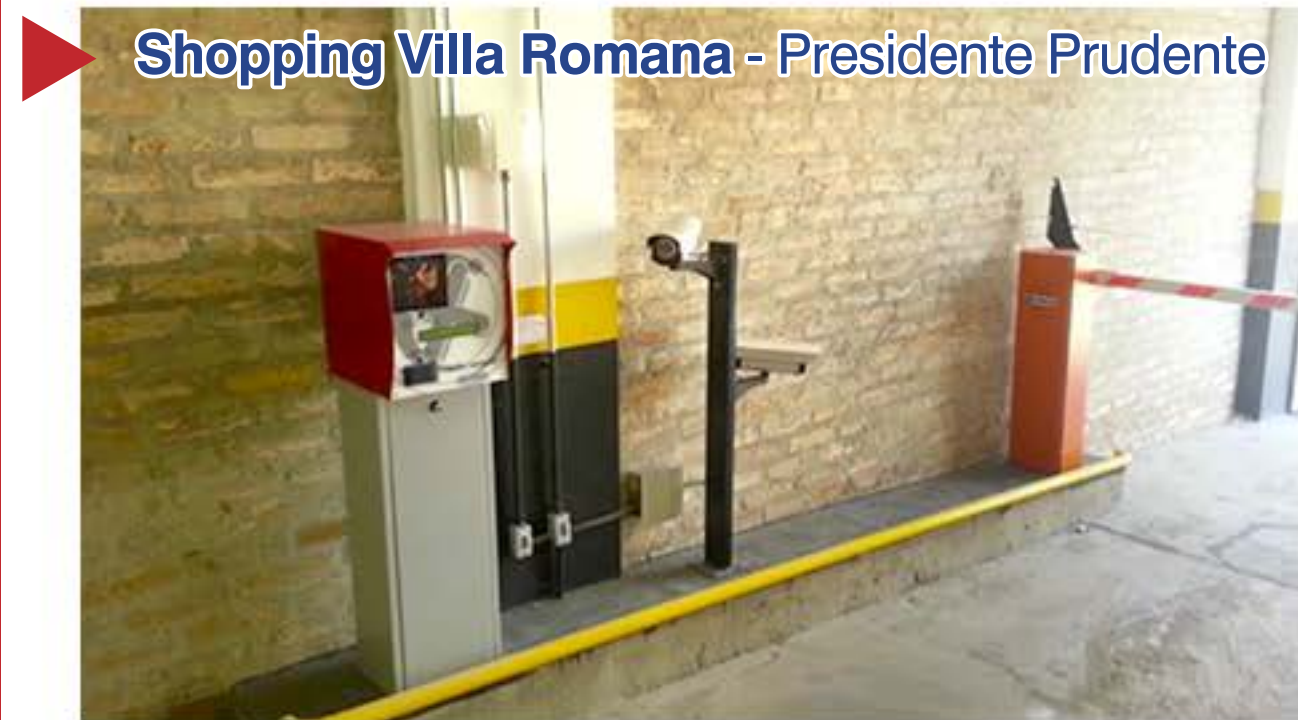
Shopping Villa Romana - Presidente Prudente